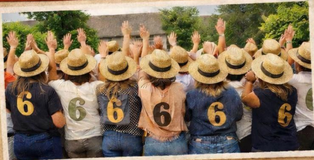
Photo de groupe